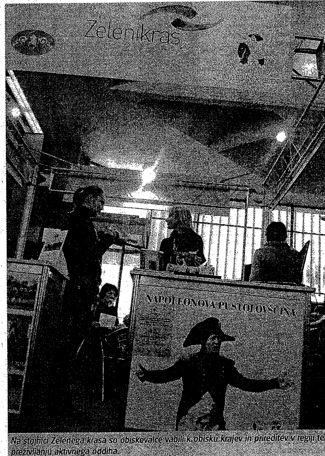
Na stojnici Zelenega krasa so obiskovalce vabili k obisku krajev in prirediteljev v regiji ter preživljanju aktivnega oddiha.