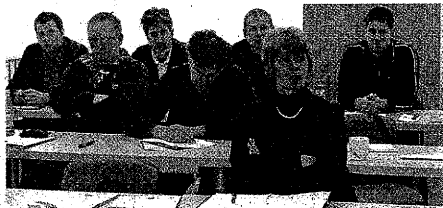
Predavanje v cerkniškem Brestu na temo »Eko-inovacije so dober posej« je prisluhnilo 14 zaposlenih iz Bresta, dva predstavnika podjetja Vibacom, dva predstavnika Srednje gozdarske in lesarske šole iz Postojne ter predstavnika organizatorja RRA Notranjsko-kraške regije, d.o.o., ki so bili z vsebino izobraževanja zelo zadovoljni.

Izobraževanja za velika in srednja podjetja na temo Eko-inovacije so dober posej, so usmerjena v dvigovanje zavesti in znanja o vlogi eko-inovativnosti v podjetjih ter ozaveščanje poslovnih akterjev Notranjsko-kraške regije o eko-inovacijah kot ugodnih poslovnih priložnostih. Na izobraževanjih se bodo udeleženci spoznali s temeljnimi pojmi inovacijskega sistema, modelom poslovne evolucije, ključnimi poslovnimi procesi in modeli odnosov, značilnostmi inovacijskih procesov in številni primeri dobrih praks inovacij. Še posebej o t. i. inovaciji za trajnostni razvoj. O teh so notranjsko-kraški gospodarstveniki razpravljali že na letošnji 3. razvojni konferenci, ki je bila organizirana junija letos. Da je inovativnost vzvod družbenih sprememb in ne samo gospodarske rasti, dokazujejo primeri dobrih praks številnih tujih pa tudi slovenskih podjetij, ki so bila prej v rdečih številkah, zdaj pa uspešno poslujejo, med njimi Ste-