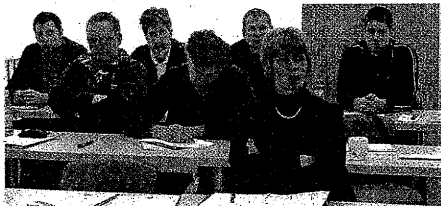
Predavanju v cerkniškem Brestu na temo: Ekoinovacije so dober posel , je prisluhnilo 14 zaposlenih iz Bresta, dva predstavnika podjetja Javor iz Pivke, predstavnica Srednje gozdarske in lesarske šole iz Postojne ter predstavnici organizatorja RRA Notranjsko-kraške regije d.o.o., ki so bili z vsebino izobraževanja zelo zadovoljni.

Izobraževanja za velika in srednja podjetja na temo: Ekoinovacije so dober posel , so usmerjena v dvigovanje zavesti in znanja o vlogi eko-inovativnosti v podjetjih ter ozaveščanje poslovnih akterjev Notranjsko-kraške regije o eko-inovacijah kot ugodnih poslovnih priložnostih. Na izobraževanjih se bodo udeleženci spoznali s temeljnimi pojmi inovacijskega sistema, modelom poslovne evolucije, ključnimi poslovnimi procesi in modeli odnosov, značilnostmi inovacijskih procesov in številnimi primeri dobrih praks inovacij, še posebej o t. i. inovaciji za trajnostni razvoj. O teh so notranjsko-kraški gospodarstveniki razpravljali že na letošnji 3. razvojni konferenci, ki je bila organizirana junija letos. Da je inovativnost vzvod družbenih sprememb in ne samo gospodarske rasti, dokazujejo primeri dobrih praks številnih tujih pa tudi slovenskih podjetij, ki so bila prej v rdečih številkah, zdaj pa uspešno poslujejo, med njimi Ste-