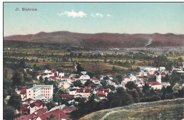
Ilirska Bistrica I. 1908