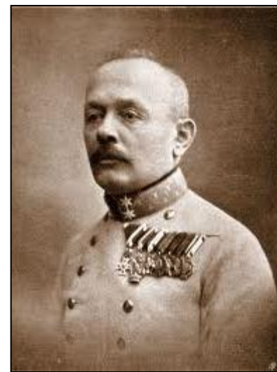
Svetozar Borojević (1856 – 1920)